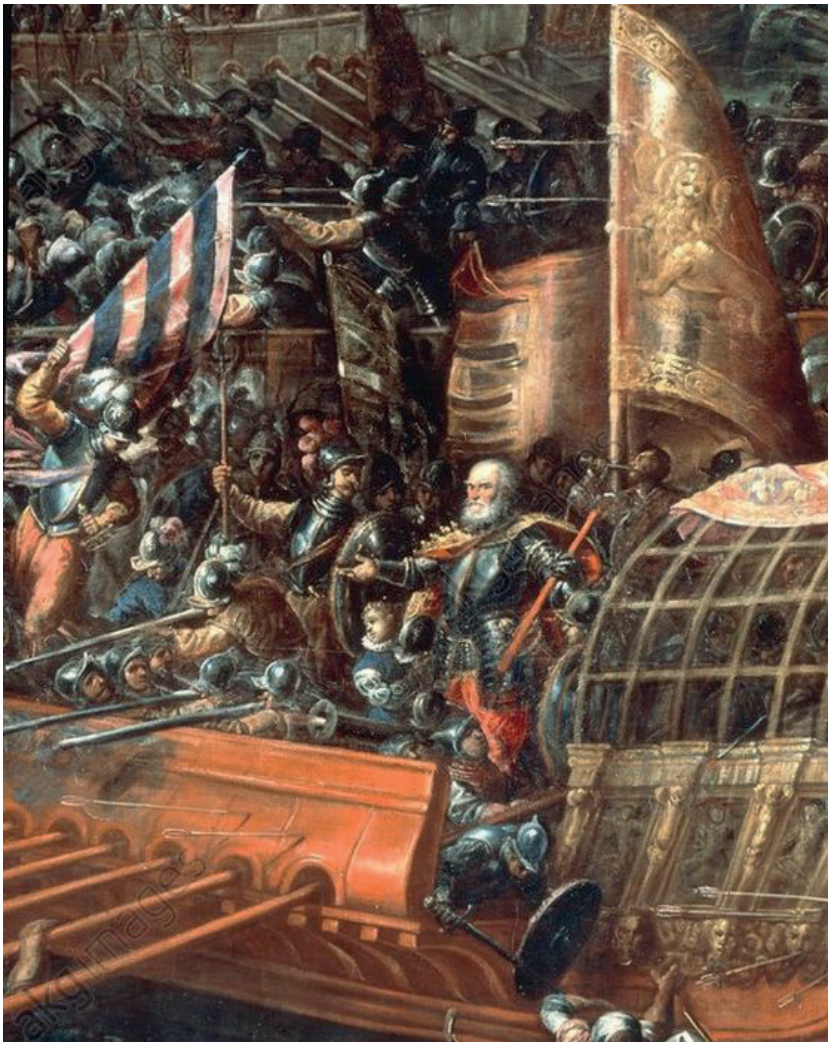
A sinistra: Sebastiano Venier (1496-1578) Capitano Generale da Mar e futuro Doge di Venezia, affronta intrepido il Turco alla battaglia di Lepanto. Accanto a lui, il gonfalone di San Marco. Particolare da un dipinto di Andrea Vicentino del 1603. Venezia. Palazzo Ducale.